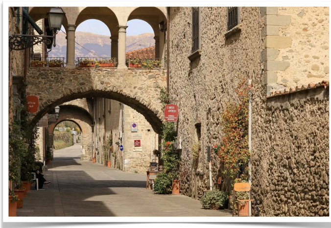
Veduta di Filetto