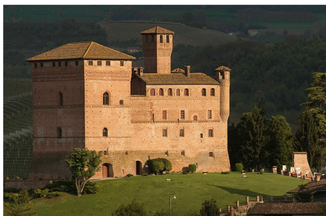
Castello di Grinzane Cavour