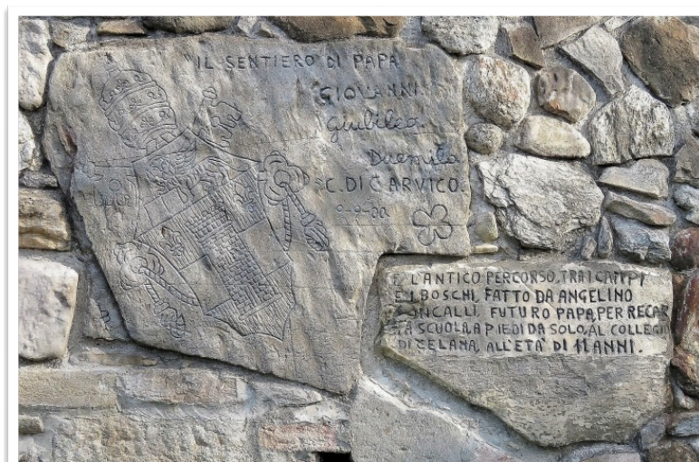
Scultura popolare del sentiero